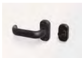
(detalle libre/ocupado) (détail libre / occupé)